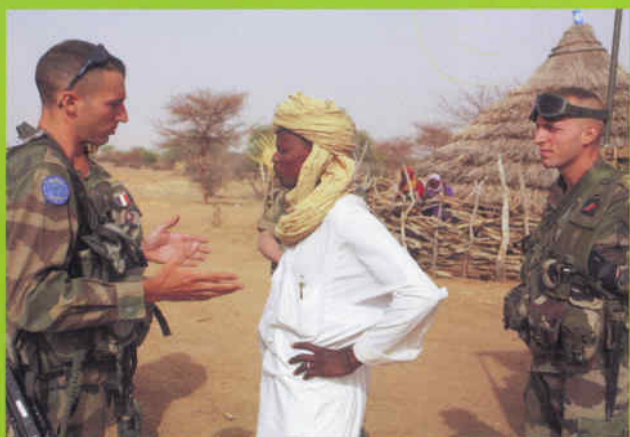
Des unités opérationnelles et projetables partout dans le monde. Ici, l'Eufor Tchad/RCA à proximité du camp de Forchana.

Au service de la sécurité de nos concitoyens et de la défense des intérêts nationaux et internationaux, les armées doivent répondre à des conditions de préparation et d'engagement opérationnels exigeantes - l'objectif étant de disposer de 60 % des effectifs dévolus aux unités opérationnelles, contre 40 % pour le soutien.