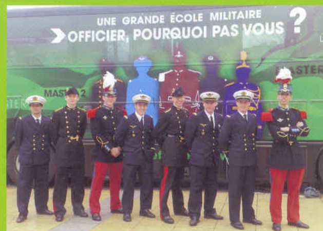
L'opportunité pour chacun d'intégrer une grande école militaire. Opération Défense Campus Tour (février 2008).

Au sein des armées, une large part des officiers est issue du corps des sous-officiers et une grande partie des sous-officiers a été initialement recrutée comme militaire du rang. Par ailleurs, la Défense continue de jouer un rôle d'intégrateur social au profit des jeunes les moins qualifiés. Chacun peut avoir accès à une formation et à un métier offrant des perspectives professionnelles valorisantes lui permettant à terme de bénéficier de très bonnes conditions de reconversion.