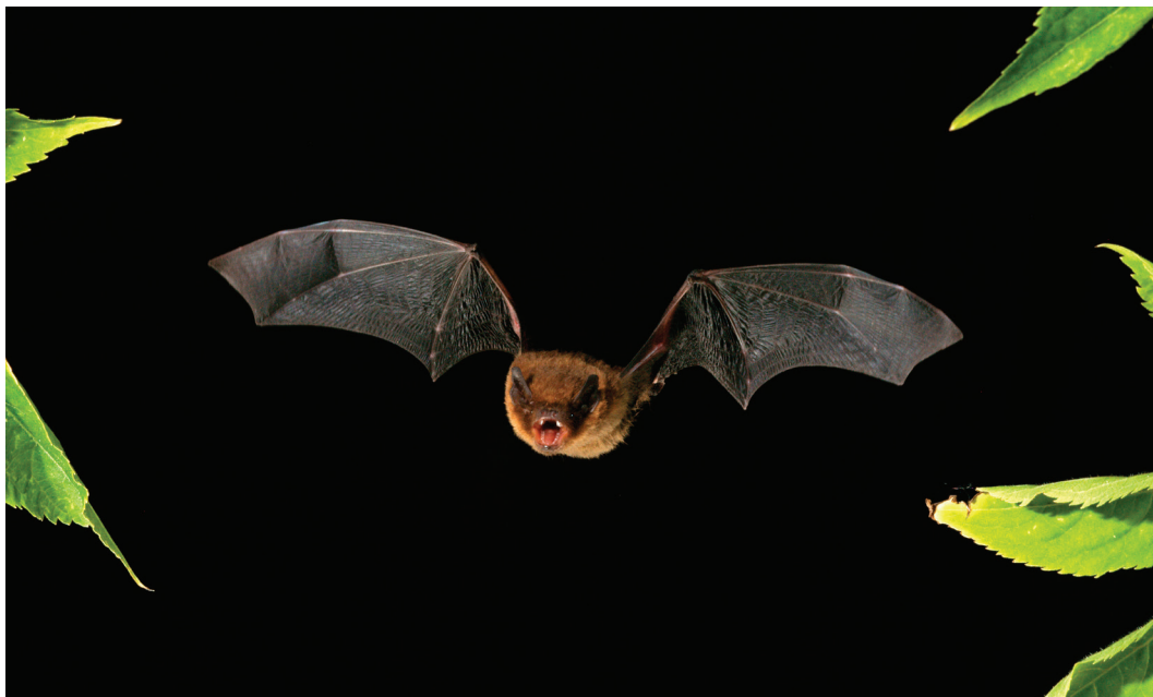
Chauve-souris en vol. Elle compte parmi les 30 espèces de chauves-souris locales les plus petites et peut être happée par le rotor des éoliennes.

En Suisse, contrairement à l'Allemagne par exemple, les centrales éoliennes s'implantent plutôt timidement. Un argument contre l'utilisation de l'énergie éolienne est le danger pour les oiseaux et les chauves-souris. Un projet de recherche dans le Canton des Grisons fournit désormais des informations concernant les conséquences d'une installation éolienne sur les oiseaux et les chauves-souris.